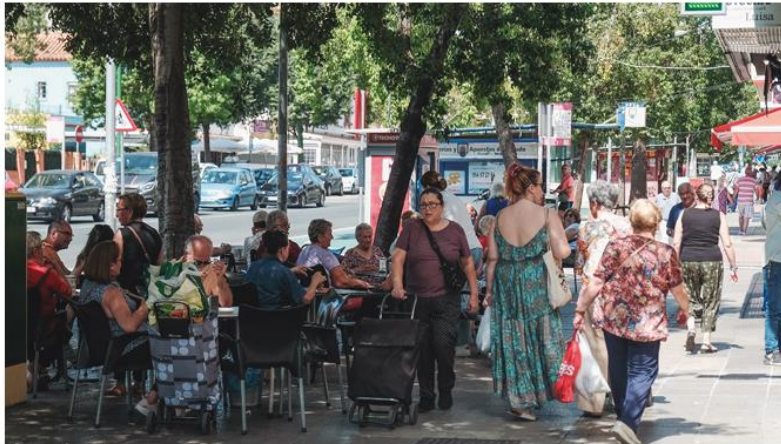
Figura 1 En la Avenida del Marqués de Pickman coinciden la Actividad Propia de una Avenida Principal con la Concurrencia de Vecinos en Bares, Cafeterías y Comercios de Proximidad