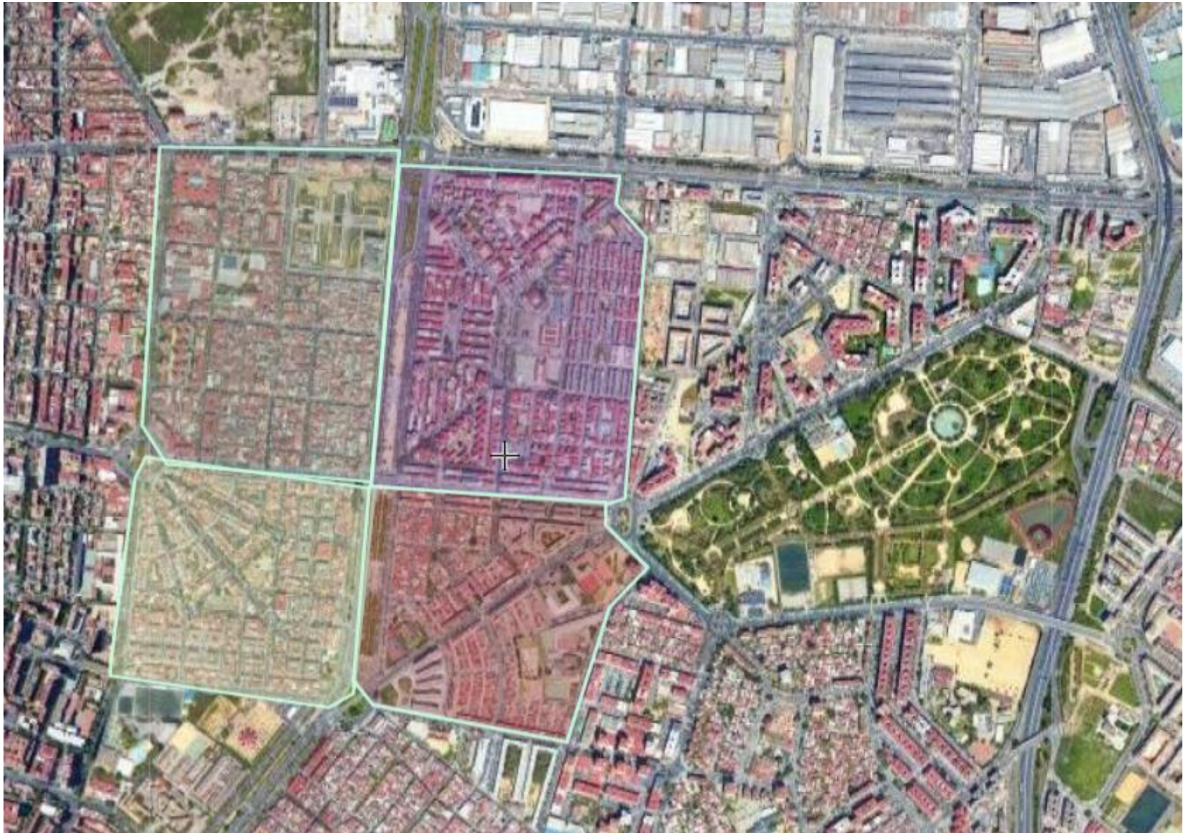
Cuatro barrios en la divisoria socioeconómica del Tamarguillo